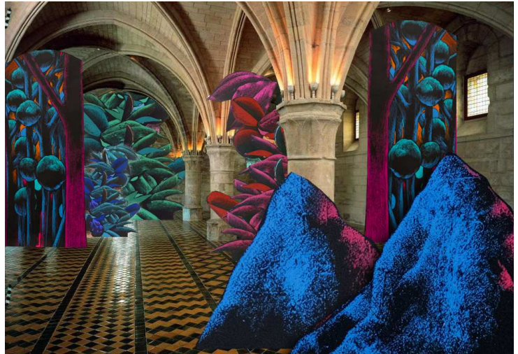
Julien Colombier, installation, panneaux de bois, acrylique, simulation pour la salle des religieuses, 2018

à l'abbaye de Maubuisson du 19 mai au 5 octobre 2019